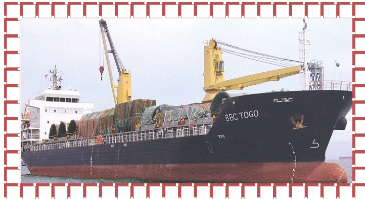
MS „Wealthy“ GmbH & Co.KG (MS BBC Togo“)